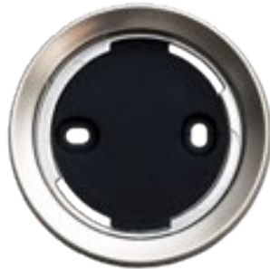
Soporte de Pared Incluido