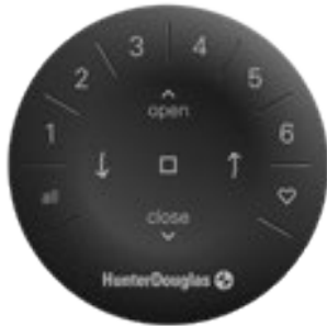
Control Remoto Generación 3